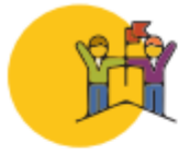
Intercambios de Erasmus+