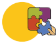
Educación no formal