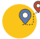
Prácticas en Europa