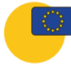
Voluntariado del Cuerpo Europeo de Solidaridad