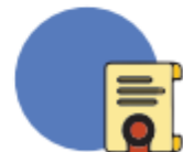
Concursos y premios