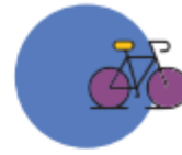
Movilidad de jóvenes trabajadores