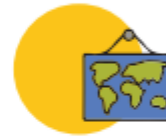
Becas nacionales e internacionales